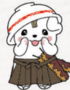
佐野ブランドキャラクター「さのまる」の佐野市